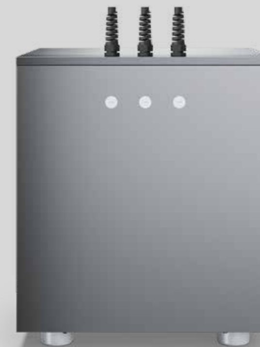
Aquabar Box 150