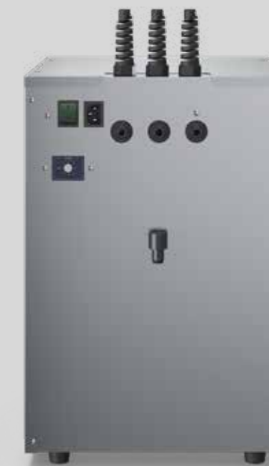
Aquabar Box 80