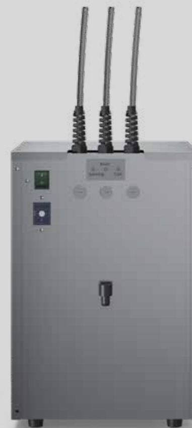
Aquabar Box 60