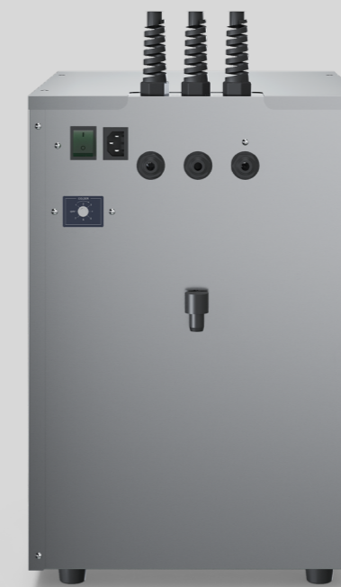
Aquabar box 80

Upp till 75 % energibesparing när enheten är i standbyläge (tillgängligt för versionen med varmvattenalternativ).