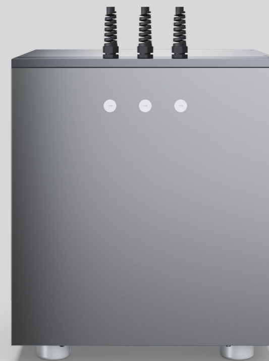
Aquabar box 150