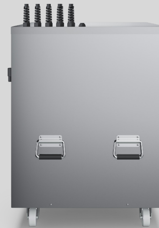
Aquabar box 280